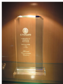
CROWN 全球最佳代理商奖