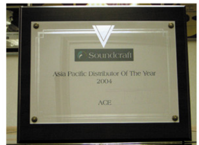
Soundcraft 全球最佳代理商奖