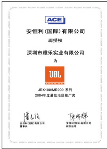
深圳市雅乐实业有限公司 荣获——JRX100/MR900系列 2004年度最佳地区推广奖