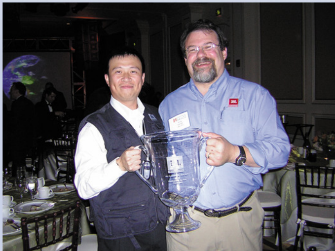
JBL Pro, Best Distributor of the Year 2004. JBL全球最佳代理商奖

这与ACE全体员工多年奋战在专业音、视频、扩声、灯光等领域的不懈努力分不开的。而且与ACE旗下各分公司和地区代理商们的辛勤耕耘是分不开的！有见及此，ACE高层决定给予多年来默默耕耘，在各地区取得优秀业绩和长足进步的公司进行嘉奖。乘着载誉归来的东风，ACE更成为了中国国家大剧院的两家预成交供应商的其中之一，并承包了上海东方艺术中心这超大型、标志性工程的音频控制系统，扬声器与音源、视频监控和内部通讯系统、灯光控制等系统。