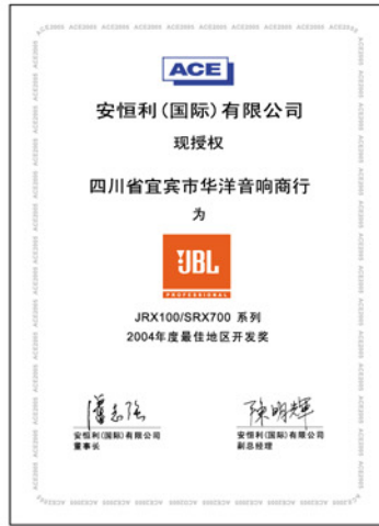
四川省宜宾市华洋音响商行 荣获——JRX100/SRX700系列 2004年度最佳地区开发奖