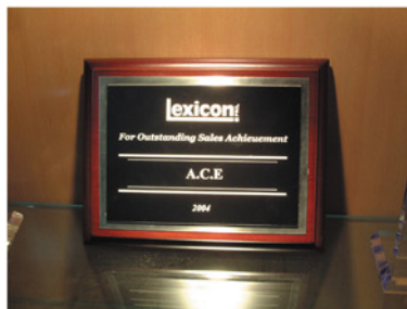
Lexicon 全球最佳代理商奖