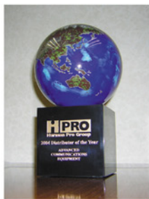
哈曼集团授予 全球最佳代理商奖