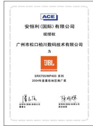
广州市松口柏川数码科技有限公司 荣获——SRX700/MP400系列 2004年度最佳地区推广奖