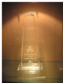
dbx 全球最佳代理商奖